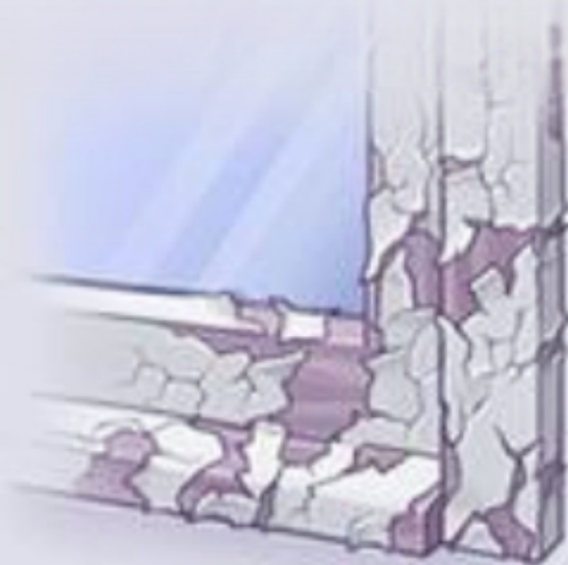
تکه های رنگ ساختمان های قدیمی