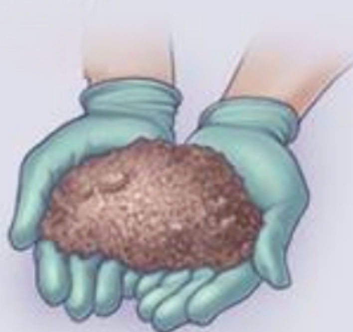
خاک آلوده نزدیک بزرگراه ها، کارخانه ها یا فرودگاه ها