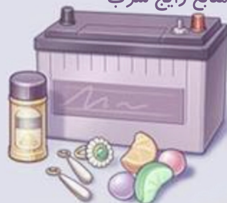
باتری های سربی ، برخی از جواهرات ادویه جات، آب نبات و داروهای سنتی وارداتی